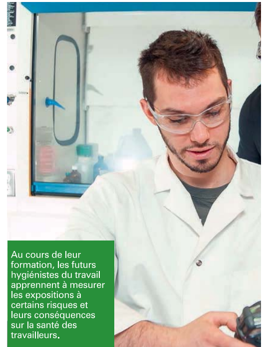
Au cours de leur formation, les futurs hygiénistes du travail apprennent à mesurer les expositions à certains risques et leurs conséquences sur la santé des travailleurs.