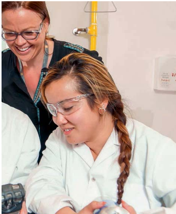
CEGEP de Jonquière